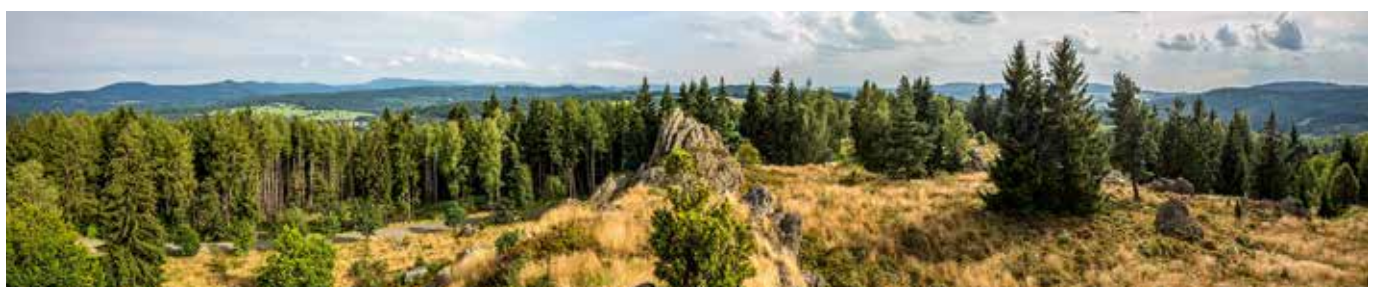
Naturdenkmal „Gneis am Hochfels“ – herrliche Weitblicke genießen