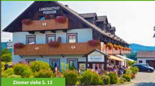
Zimmer siehe S. 12