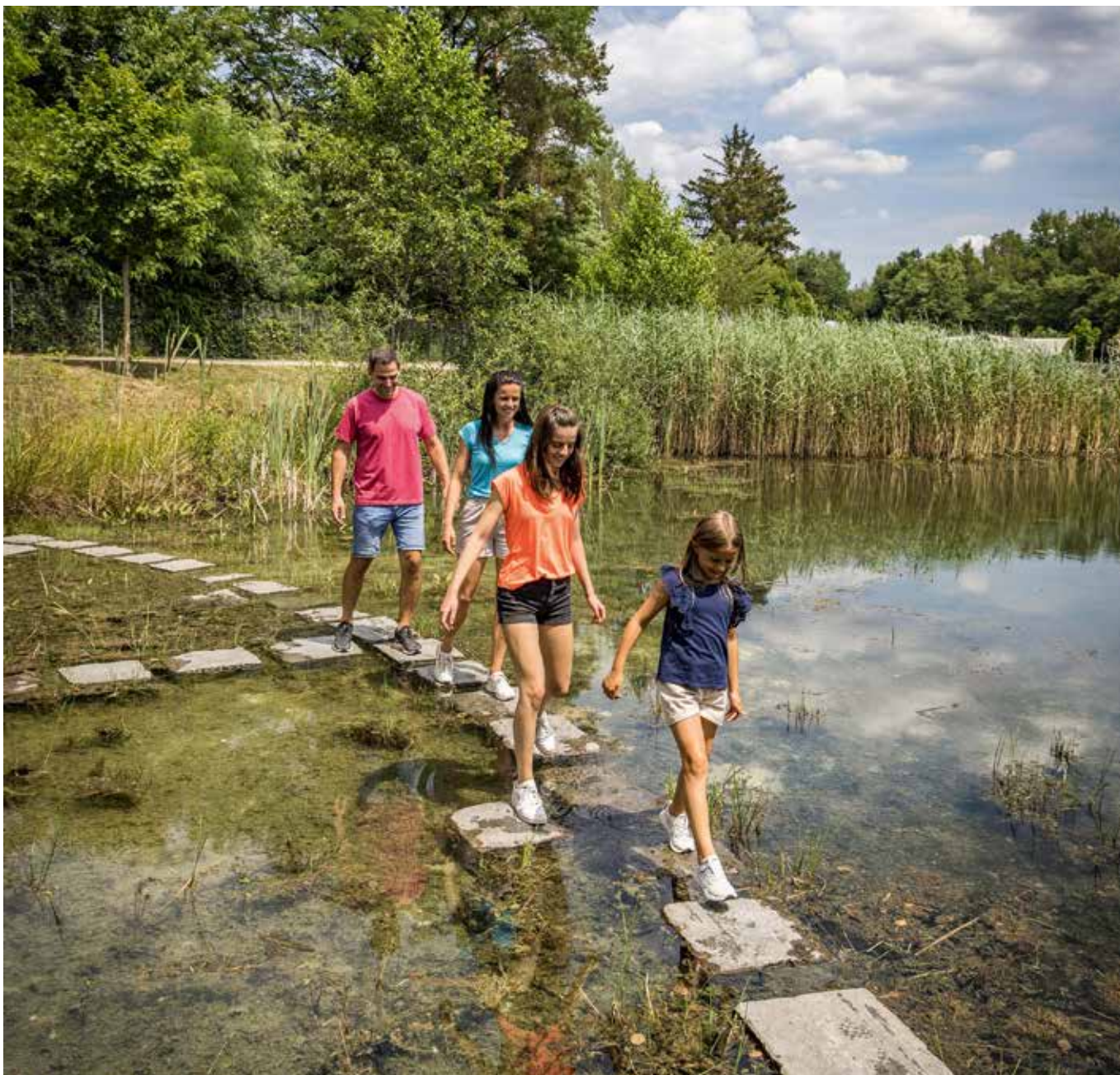
Im Erlebnispark Wasser-Fisch-Natur bei Wackersdorf