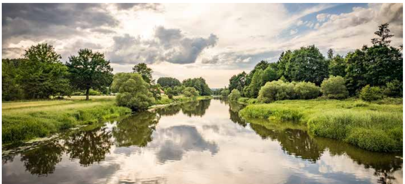
Stille Momente an der Naab genießen