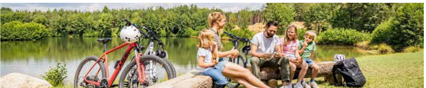
Gemütliche Pause an der Sandoase Sulzbach bei Bruck i.d.OPf.