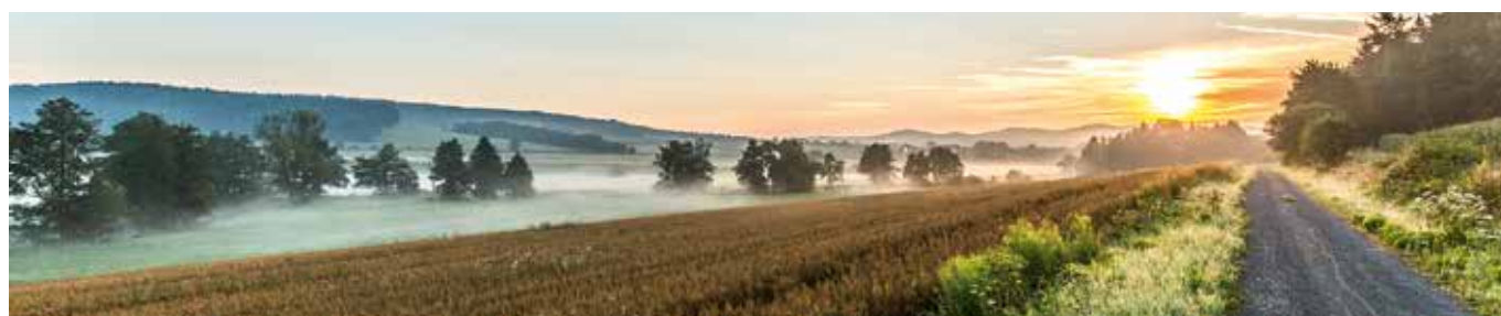
Morgenstimmung am Bayerisch-Böhmischen Freundschaftsweg