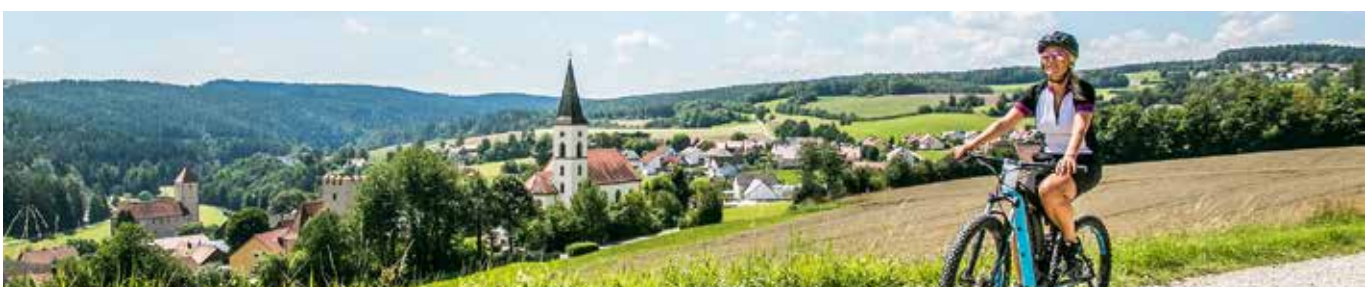
Radlspaß auf dem Pfreimdtal-Radweg bei Trausnitz