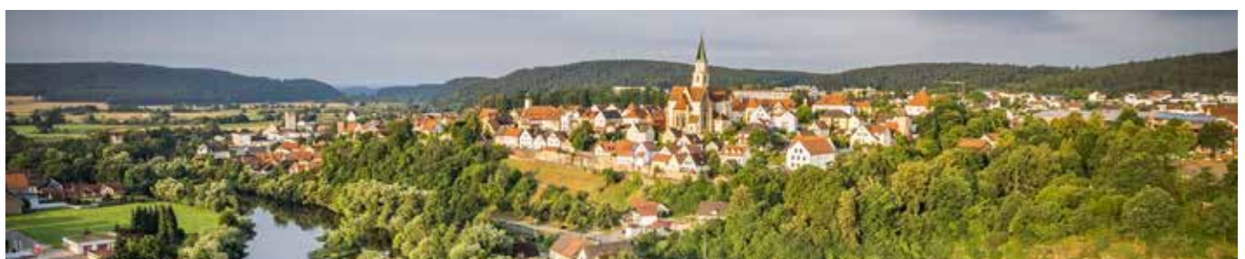
Nabburg - auch von fern majestätisch anzusehen