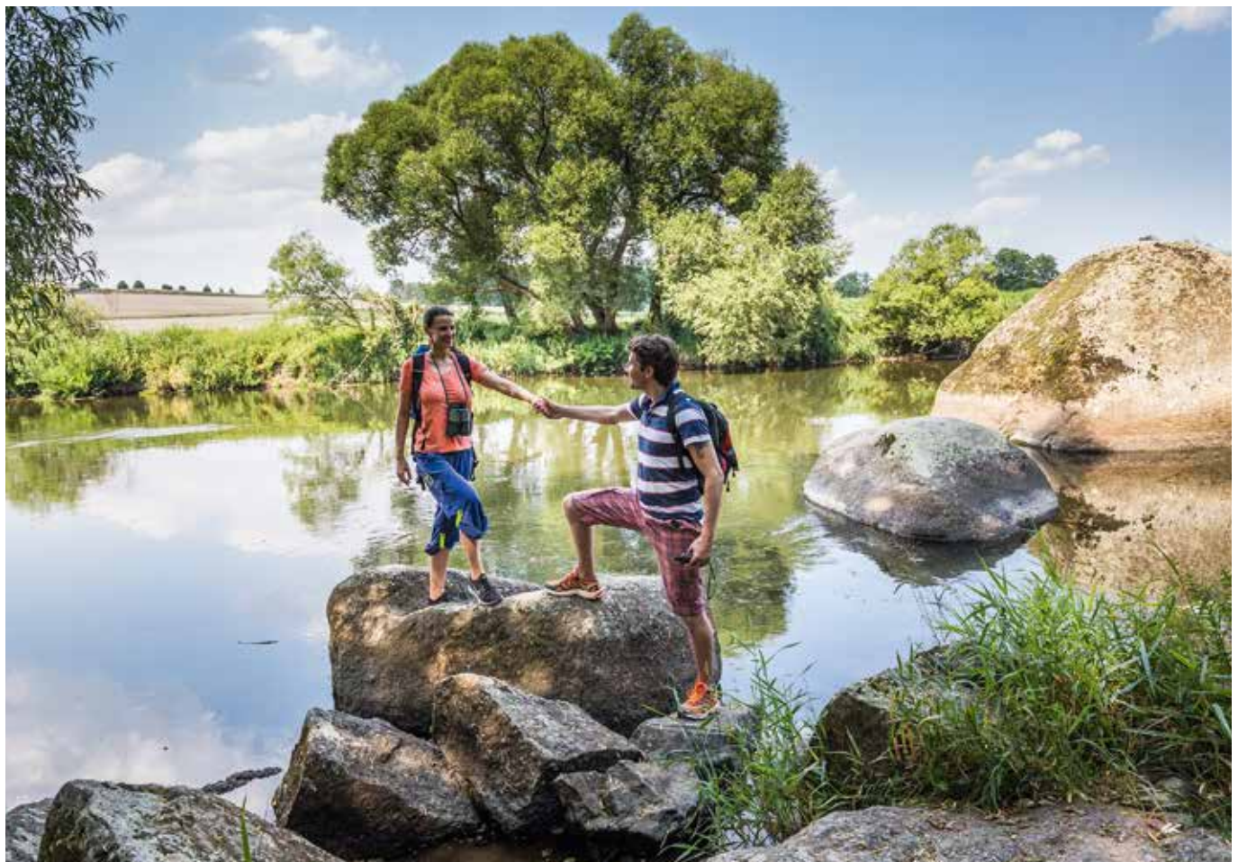
Entspannte Wanderung im Regental bei Nittenau