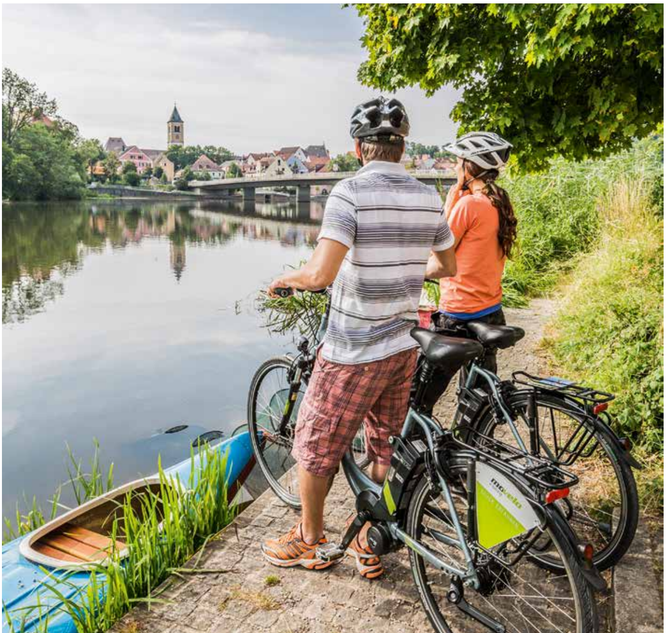
Auf dem Naabtal-Radweg bei Burglengenfeld