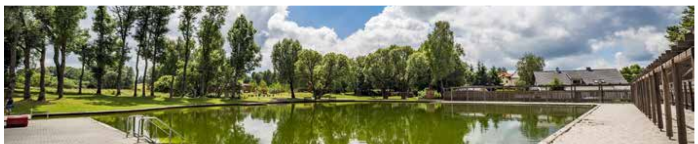
Erfrischung im Moorbad in Schönsee