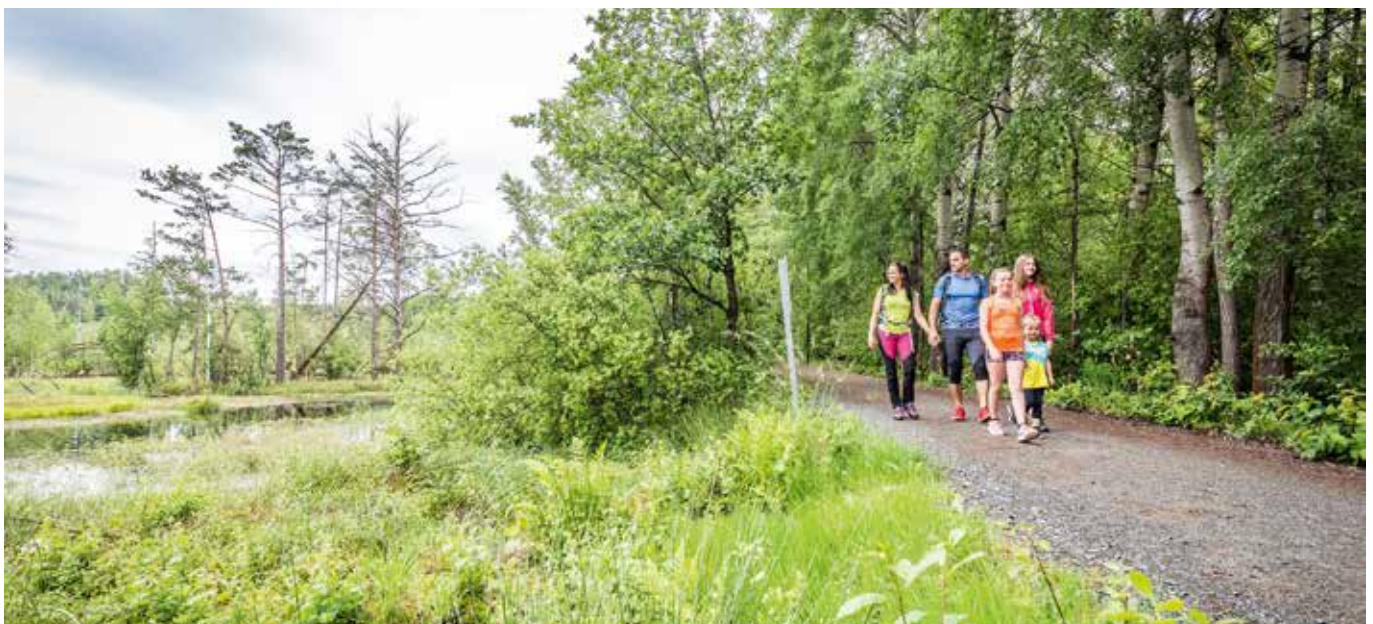
Auf dem Goldsteig durch das Prackendorfer und Kulzer Moos